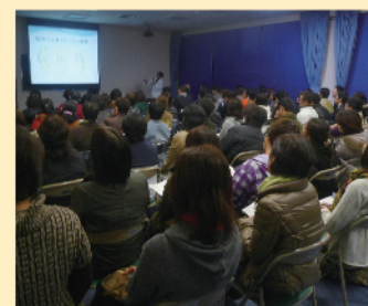
▲会場には100名以上の参加者