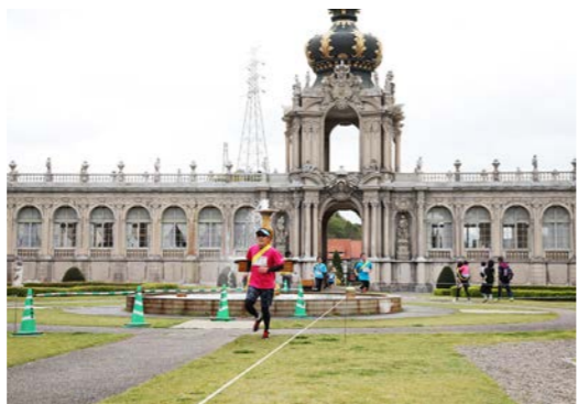
パークのシンボル、ツヴィンガー宮殿を走る