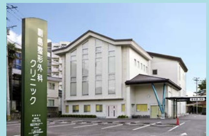
副島整形外科クリニック

佐賀県武雄市武雄町大字富岡 7641 番地 1 ☎ 0954-20-0388 FAX:0954-20-0377