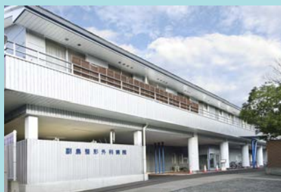
副島整形外科病院

佐賀県武雄市武雄町大字富岡 7641 番地 1 ☎ 0954-20-0388 FAX:0954-20-0377