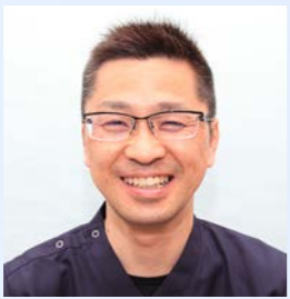
看護部長 水田より一言

5月12日はナイチンゲール生誕の日 ナイチンゲールの功績 イギリス人のフローレンス・ナイチンゲールは、人を助けたいという強い思いから看護を学びます。クリミア戦争で負傷した兵士の看護に赴き、手当のかたわら病院内を視察して回り、不衛生な環境の改善を訴えます。院内の衛生環境が整うと兵士の死亡率が低下し、その功績が称えられます。その後も熱心に執筆や教育に取り組み、生涯にわたり看護の分野に貢献しました。